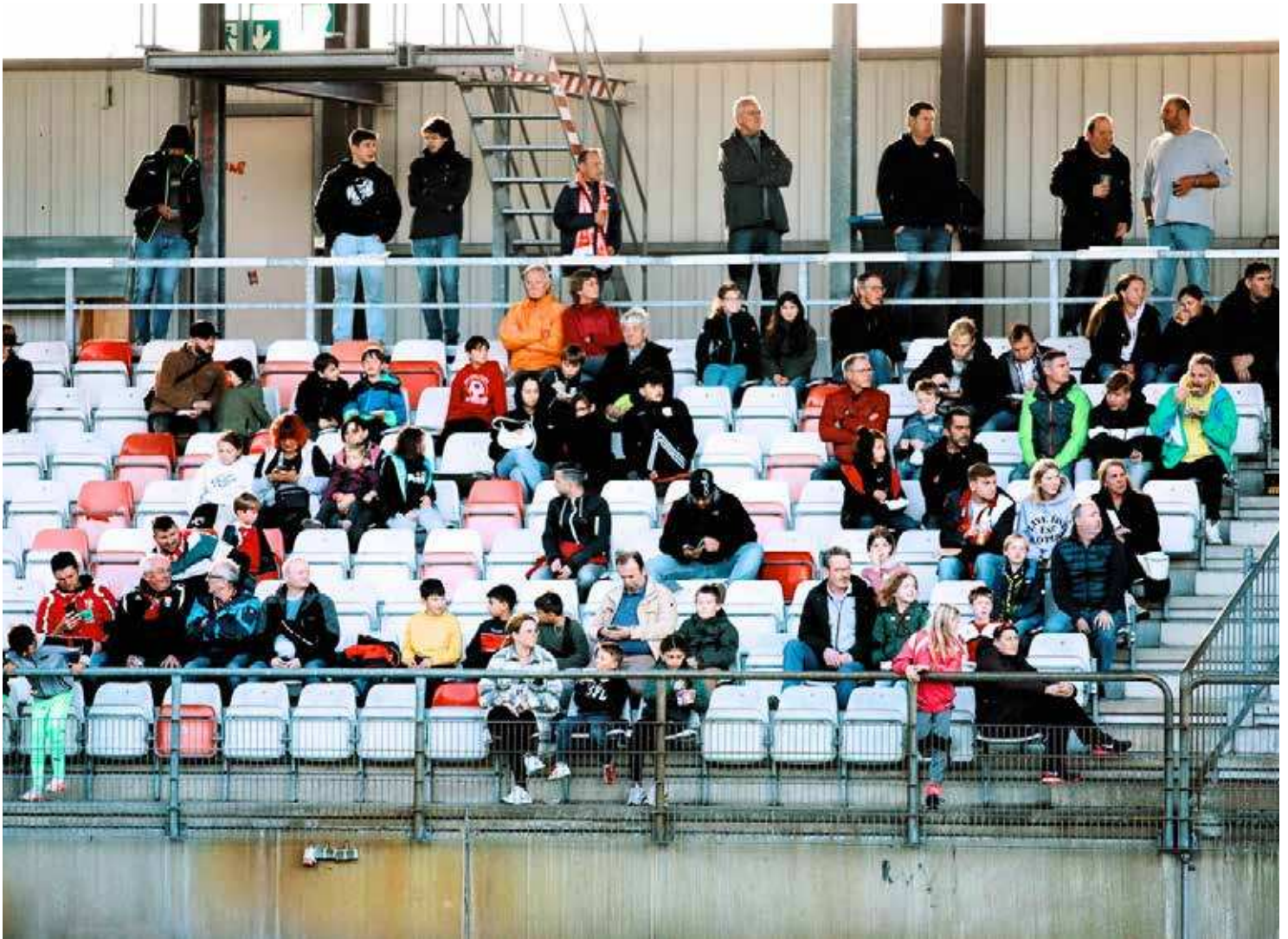
DIE ZUSCHAUER IM BLOCK E AM FAMILIENTAG BEIM HEIMSPIEL IM LETZTEN JAHR GEGEN ALEMANNIA AACHEN.

Nach dem positiven Feedback während des Hinrundenspiels gegen Alemannia Aachen, wird das Derby gegen FC Gütersloh unter dem Motto "Stadtwerke Ahlen Familientag" ausgerichtet. In den vergangenen Wochen wurden insgesamt 1500 Freikarten in Zusammenarbeit mit den Schulen und den Stadtwerken Ahlen an Schülerinnen und Schüler in Ahlen verteilt.